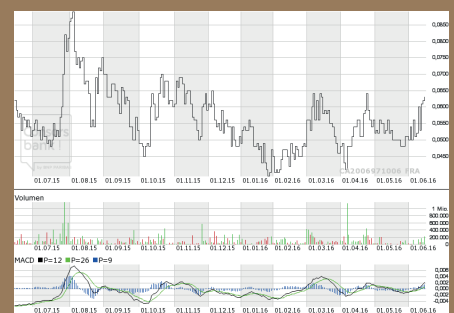
Chart Deutschland ( Frankfurt )