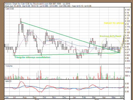
Chart Kanada ( TSX.V )